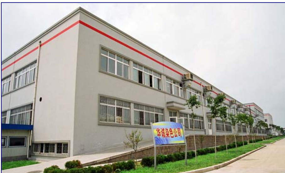
Qingdao Dyeing & Finishing House

Der chinesische Hersteller von Premium-Strickwaren zählt zu den Top-500 Industriefirmen in ganz China. Bereits 2003 wurde das Unternehmen mit dem Titel „superior eco-friendly enterprise“ ausgezeichnet.